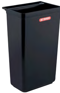
12x Ref. 71134 440x350xh160 mm